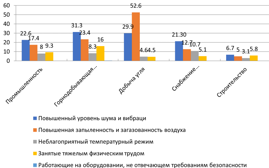
Рис.2 - Удельный вес работников, занятых во вредных и других неблагоприятных условиях труда

дования и взрывчатых веществ, экстремальными температурами, воздействием токсичных веществ и др. (рисунок 2)