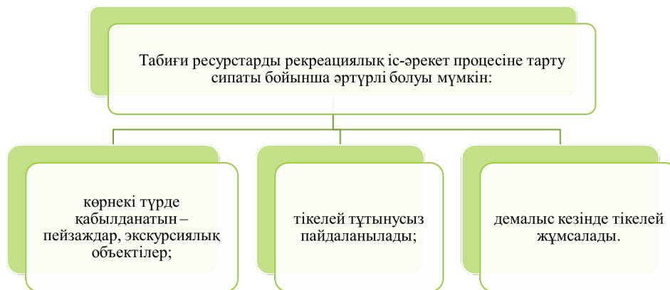
Сурет 1 – Табиғи ресурстарды рекреациялық іс-әрекеттері [6]

Физикалық рекреациялық ресурстар - бұл физикалық-географиялық ресурстарға (геологиялық, геоморфологиялық, климаттық, гидрологиялық және жылулық) жіктелген жансыз табиғаттың