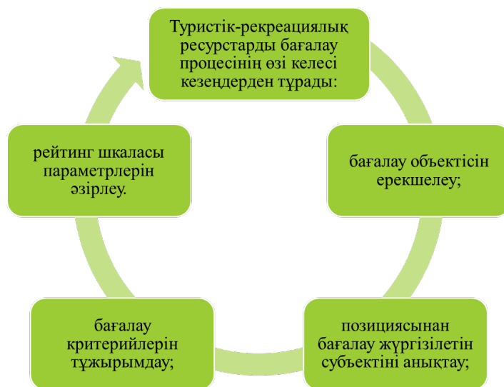
Сурет 3 – Туристтік-рекреациялық ресурстарды бағалау [9]

Бұл туристік және рекреациялық ресурстардың толық сипаттамасын, олардың тартымдылығын, көру уақытын, аумағын (көлемін), сапасын, даму немесе пайдалану жағдайларын, уақыт бірлігінде осы ресурсты пайдалана алатын туристер (рекреационистер) санын сандық бағалауды қамтиды. оны сарқылтпай және экологиялық тепе-теңдікті бұзбай пайдаланудың мәні зор. Территориялардың экономикалық дамуындағы туризм мен рекреацияның рөлін күшейтудің заманауи жағдайында бағалау мәселелері бірінші кезектегі мәнге ие (сурет 3).